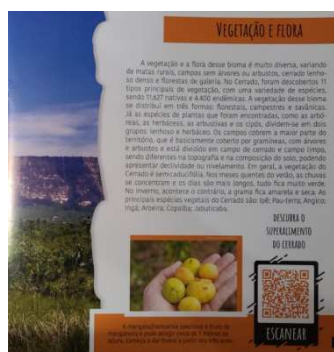
Figura 4: Página do livro: Tudo sobre o Cerrado

Dessa maneira, a indicação do livro Tudo sobre o Cerrado que atende a proposta da educação bilíngue se deu pelo fato deste livro ter um bom conteúdo, boas avaliações por parte dos leitores em livrarias virtuais e um valor acessível, abaixo de R$ 10,00. As ilustrações são bastante interativas, trazem informações visuais que seus leitores e leitoras reconheçam facilmente.