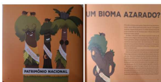
Figura 3: Apresentação dos biomas Fonte: Bensusan (2016)

O livro Cerrado: bioma torto? Traz duas passagens que merecem destaque. A primeira porque se relaciona com o imaginário social mais amplamente difundido sobre os biomas nacionais e aqueles que gozam do status de patrimônio e o bioma não tão conhecido, o Cerrado. É curioso encontrar novamente uma questão a qual diz respeito à má sorte do bioma. O segundo ponto diz respeito, novamente, à forma como as características do Cerrado são apresentadas pela visão da diversidade. Trazemos uma delas: